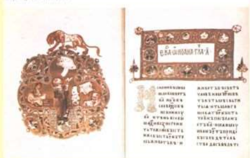
Первая рукописная книга Остромирово Евангелие

Позднее создавали книги из бумаги, но они были рукописными, а не печатными. Их многие месяцы переписывали от руки особые переписчики – писцы. Рукописных книг было мало, и стоили они дорого.